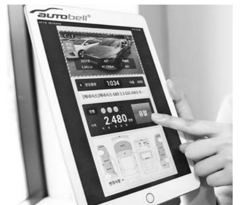
현대글로비스 중고차매입서비스 '오토벨'

국내 중고차 시장에서 현대글로비스의 중고차 매입 서비스 '오토벨'이 새로운 거래 플랫폼으로 주목받고 있다. 편리한 판매 절차와 투명한 거래가 입소문을 타면서 이용자들이 해마다 늘고 있기 때문이다. 2018년 기준 현대글로비스 중고차 경매장에 출품한 차량은 100만대를 넘어섰다. 첫 경매가 시행된 2001년 이후 17년 만의 대기록이다.