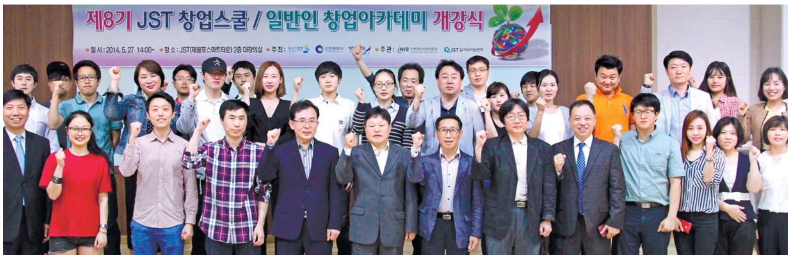
인천정보산업진흥원 8기 'JST창업스쿨' 개강 인천정보산업진흥원은 지난 27일 제물포스마트타운(JST) 대강의실에서 제8기 JST 창업스쿨(일반인 창업아카데미)을 개강했다. LST창업스쿨은 우수한 기술이나 창업 아이디어를 보유한 예비창업자를 발굴, 육성하기 위한 창업프로그램이다. 올해는 서류 및 면접을 거쳐 32명의 교육생을 선발했다. 이들에게는 오는 7월 10일까지 총 75시간에 걸쳐 창업교육과 멘토링을 진행할 예정이다.