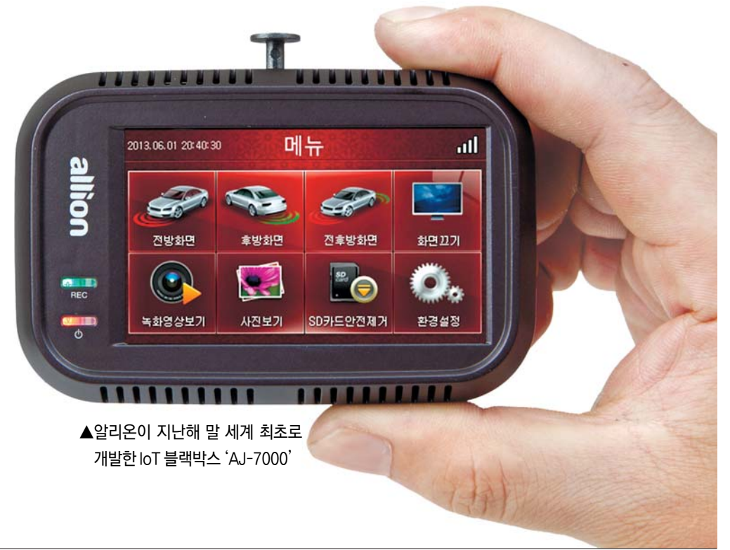
▲알리온이 지난해 말 세계 최초로 개발한 IoT 블랙박스 'AJ-7000'