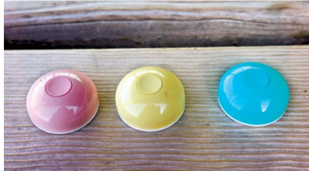
세미링크 '셔터 볼'은 올해 CES에서 디자인 이노베이션상을 받았다.