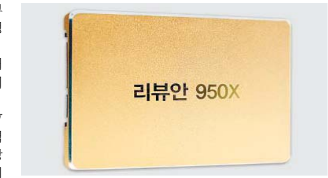
리뷰안테크 '리뷰안950X'는 기존 SSD와 달리 모듈방식으로 구성돼 있다.

리뷰안테크(대표 안현철)의 차세대 데이터 저장장치 '리뷰안950X' 솔리드스테이트 드라이브(SSD)는 가격대비 높은 성능으로 올해 많은 인기를 얻었던 상품이다. 전작인 리뷰안850X가 가격대비 높은 성능, 보급형 중 뛰어난 성능을 제공했다면, 리뷰안950X는 게임·전문가용으로 최고성능을 추구했다. 리뷰안950X 시리즈 가운데 최고인 '950X' 드라이브(DRIVE)는 최고속도 초당 2000메가바이트(MB)와 25만 초당입출력량(IOPS)을 넘는 성능을 자랑한다. 다른 경쟁 업체들은 초당 500MB 수준이다. 이러한 높은 성능으로 게임을 실행할 때 기존의 어떤 SSD보다 빠른 속도, 짧은 시간에 실행할 수 있다는 게 회사 측 설명이다. 예를 들어 8기가바이트(GB)용량의 게임이 있다면 초당 500MB의 일반 SSD는 16초가 걸려야 데이터를 읽지만, 950X 드라이브는 4초만에 8GB를 읽을 수 있다. 여기에 운영체제(OS)나 프로그램 실행에 중요한 속도인 4K IOPS 역시 25초로 여타 SSD의 3배 수준의 높은 속도를 보인다. 또 950X 드라이브는 기존의 SSD와 다르게 모듈방식으로 구성돼 있는 게 특징이다. 256GB부터 2048GB, 2테라바이트(TB)까지 소비자가 직접 장착, 업그레이드 할 수 있다. 교체기가 아