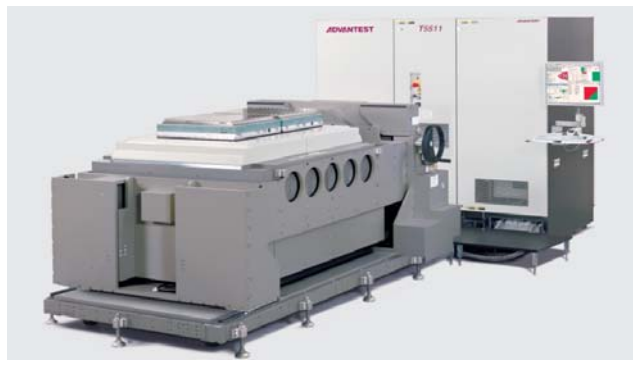
아드반테스트 'T5511'은 타이밍 트레이닝 기능을 하드웨어로 실현했다.